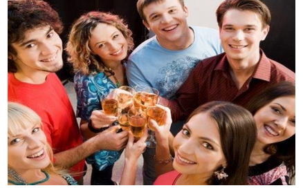
여가 생활 지원