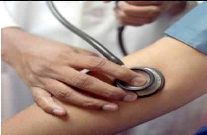
임직원 의료 지원