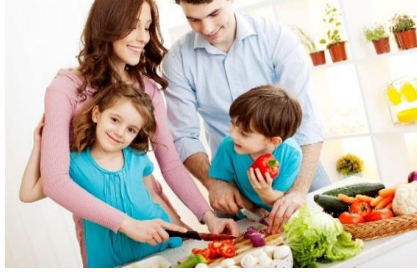
사내 편의 시설