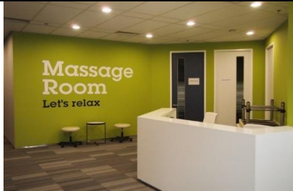
임직원 스트레스 관리