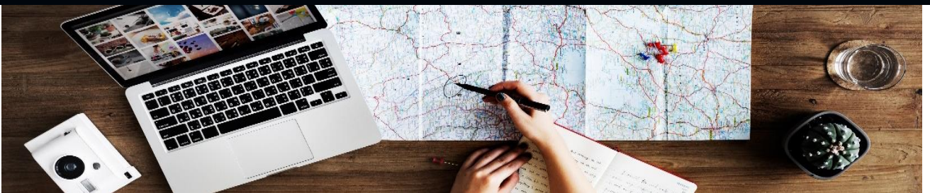
글로벌 커리어 개발 기회